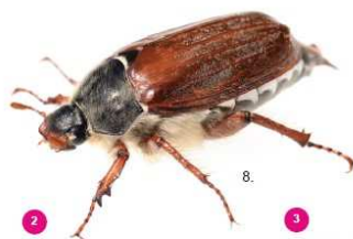
2 Melolontha melolontha Il comune maggiolino, 25-30 mm, non possiede ciuffi bianchi.