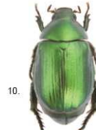
4 Anomala vitis Le specie appartenenti al genere Anomala ( Anomala vitis ), 14-18 mm e ( Anomala dubia ), 11-15 mm, sono interamente di colore verde tendente al marrone-nerastro.